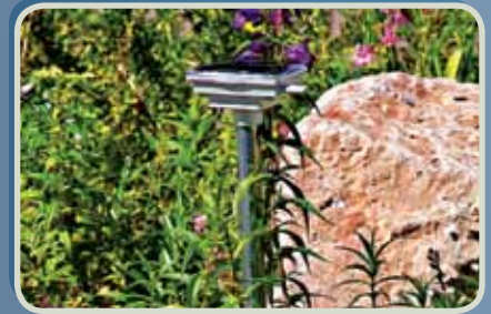
Montaggio A Colonna