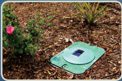
Coperchio Della Scatole Per Valvole

Il controllo di irrigazione LEIT-2ET presenta tre opzioni di montaggio per massimizzare la versatilità per qualsiasi applicazione.