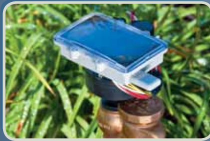
Direttamente Alla Valvola